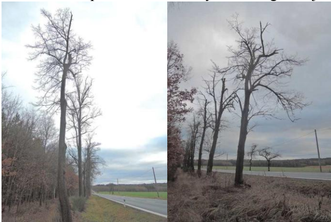
#19; 179055; po zkrácení koruny dobře regeneruje #9;178058;pouze ořez suchých větví