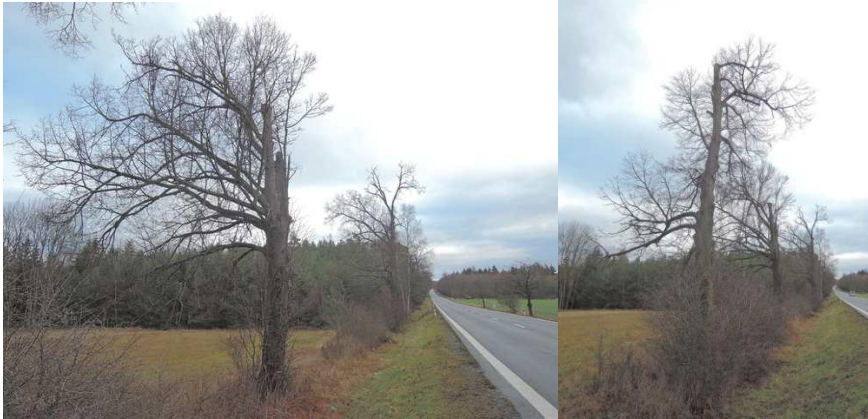
#12;179044; po zkrácení koruny dobře regeneruje, těžiště stromu je do louky #20; 179045; po zkrácení koruny dobře regeneruje